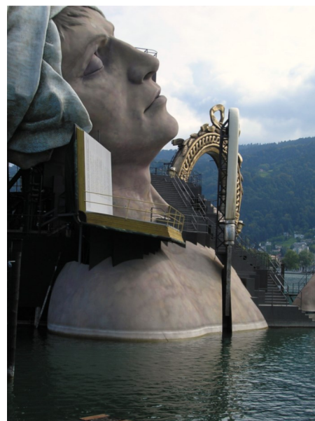
Festval de Bregenz - Décor de André Chénier posé sur le Lac de Constance - Les parties en contact avec l'eau sont en Acrystal Aqua - Autriche